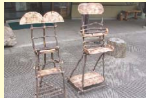
パンフレットスタンド